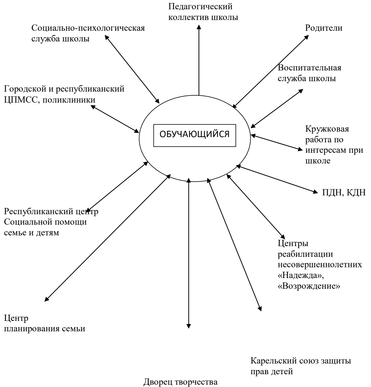
СХЕМА ВЗАИМОДЕЙСТВИЯ УЧАСТНИКОВ ОБРАЗОВАТЕЛЬНОГО ПРОЦЕССА В ХОДЕ ИНДИВИДУАЛЬНОГО СОПРОВОЖДЕНИЯ РАЗВИТИЯ ОБУЧАЮЩИХСЯ